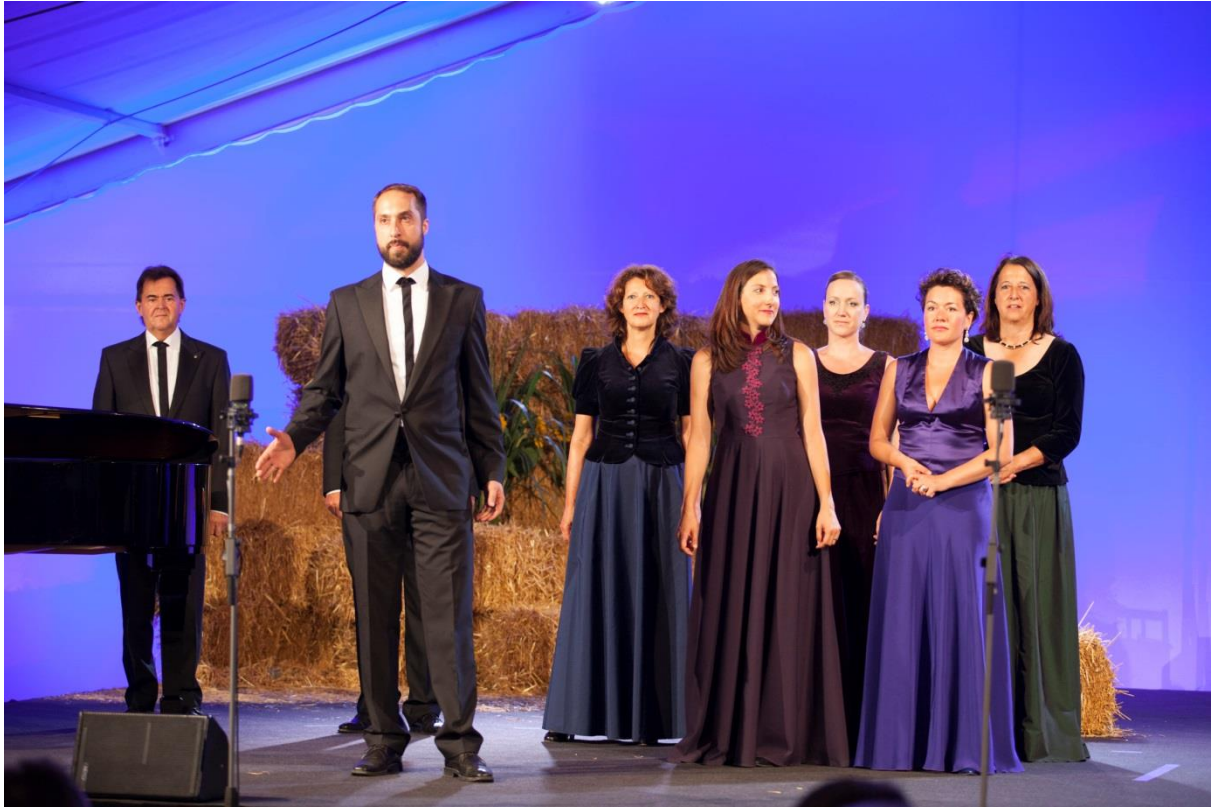
Compagnia Rossini hat die EMS-Aktionäre schon oft an der Generalversammlung begeistert.